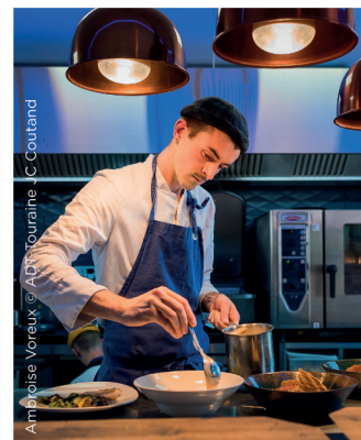
Ambroise Voreux